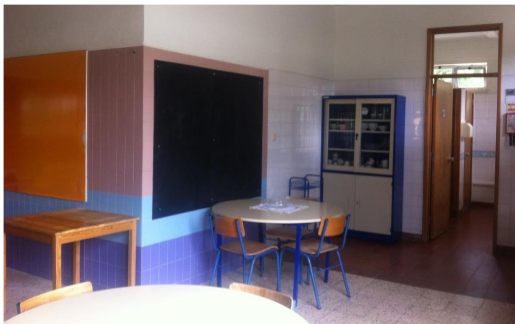
As instalações da nova Unidade de Apoio Especializado de 2.º ciclo